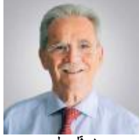
هيرقل ميلس 13 أكتوبر 2018