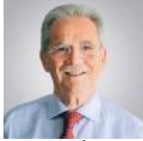
هيرقل ميليس 13 ديسمبر 2018