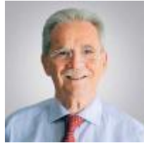
هيرقل ميليس 11 مايو 2019